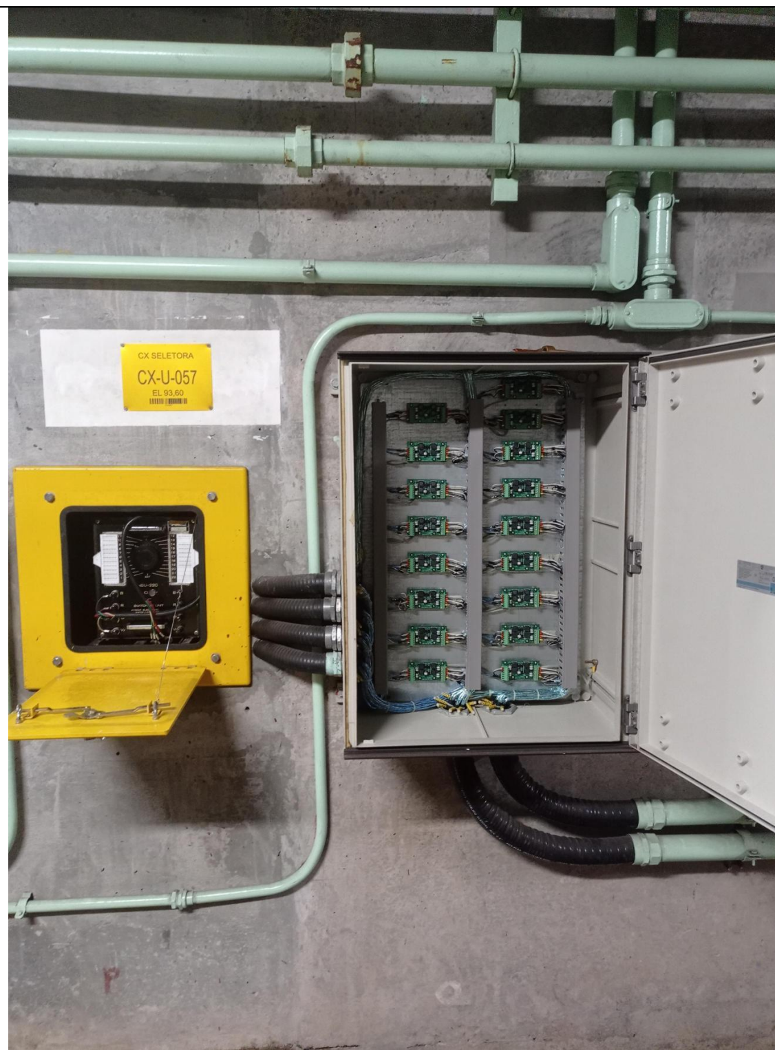
Fig. 02 - Caixa seletora (leitura manual) e Junction Box (ADAS) aberta