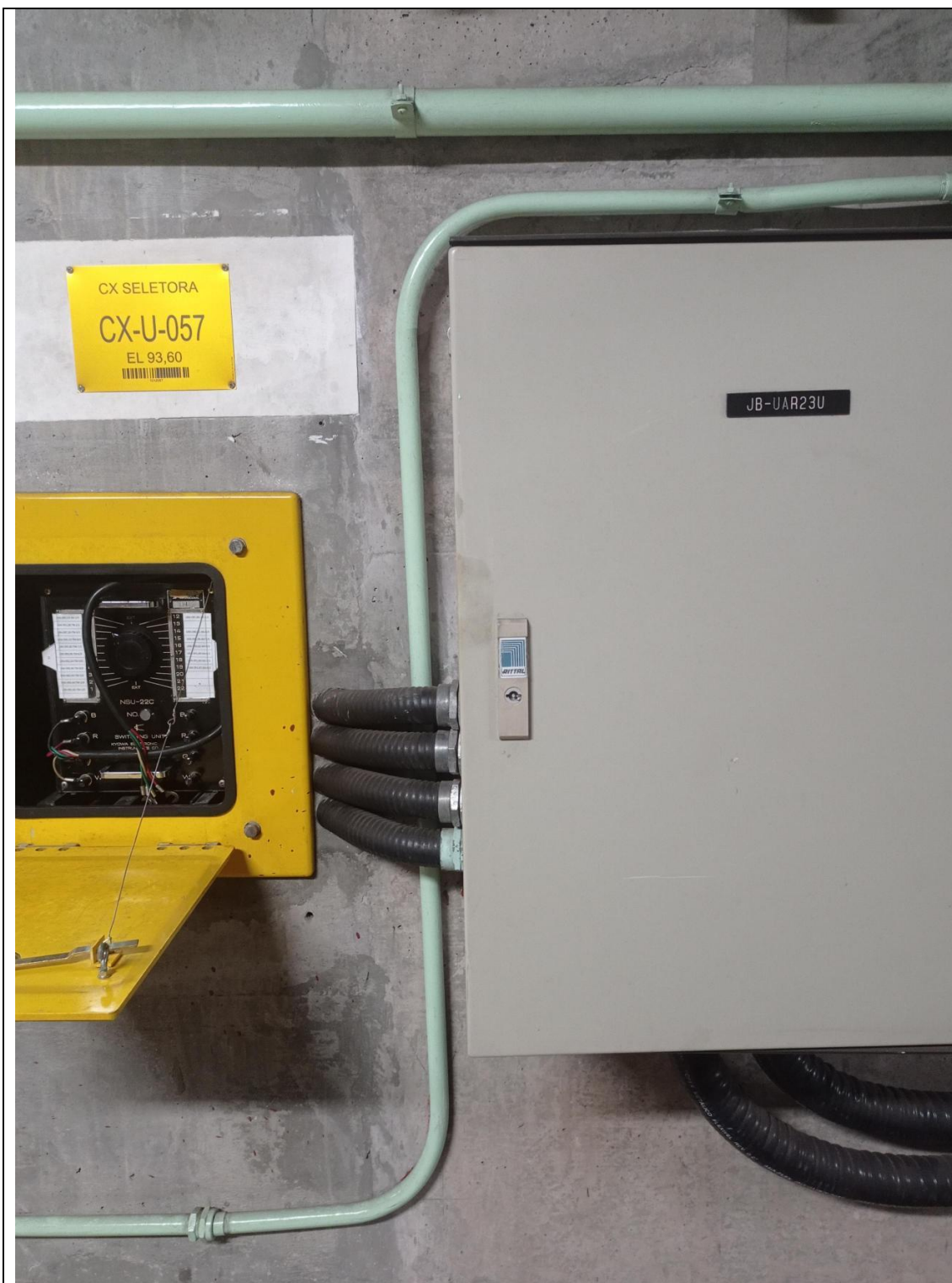
Fig. 01 - Caixa seletora para leituras manuais e Junction Box (ADAS)